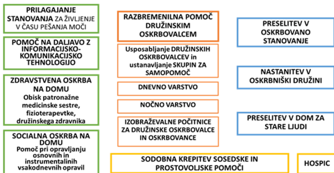
Mreža oskrbovalnih programov

Mreža oskrbovalnih programov omogoča uresničiti prevladujočo željo starih ljudi, da lahko čim dlje ali do konca življenja živijo doma, v vsakem primeru pa vsaj v svojem lokalnem okolju. Programi, ki omogočajo človeku, da lahko ostaja na jesen življenja doma, so prilagajanje stanovanja za samostojno življenje v starosti (o tem več v podpoglavju bivališča ), pomoč na daljavo z informacijsko-komunikacijsko tehnologijo (IKT), zdravstvena in socialna oskrba na domu ter drugi programi za razbremenilno pomoč družinskim oskrbovalcem (npr. dnevno varstvo, nočno varstvo, začasne namestitve). Drugi programi so še preselitev v oskrbovano stanovanje ali v dom za stare ljudi.