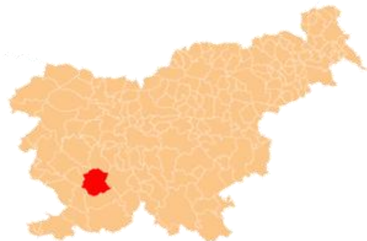
Slika 1: občina Postojna v slovenskem prostoru

Statistični podatki za leto 2023/24 kažejo, da se je po številu prebivalcev med slovenskimi občinami uvrstila na 27. mesto. Na kvadratnem kilometru površine občine je živel povprečno 65 prebivalcev; torej je bila gostota naseljenosti tu manjša kot v celotni državi (105 prebivalcev na km 2 ).